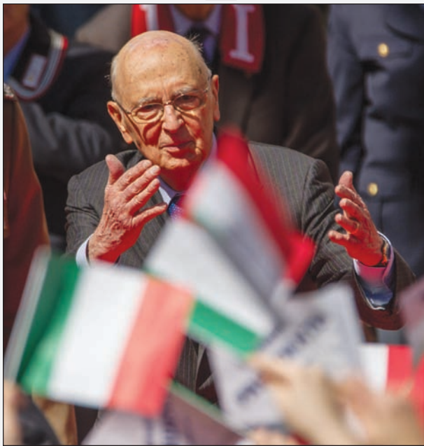
Giorgio Napolitano tra i tricolori ieri a Pesaro

"Estirpare il marcio" che da troppi anni cresce all'interno dei partiti, dare "trasparenza" al sistema di finanziamento pubblico e iniettare nuova linfa alla democrazia con immediate riforme politiche: questa la ricetta che Giorgio Napolitano prescrive ai partiti italiani, malati gravi d'Europa eppure soggetti "indispensabili" per la democrazia. Il rischio è, altrimenti, altissimo: consegnare le chiavi del Paese al "demagogico di turno".