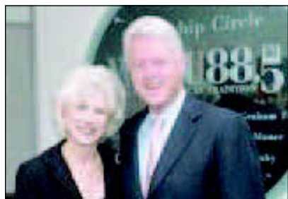
Diane Rehm con Bill Clinton

URBINO — Giovedì 11 maggio alle 11,30, nella Sala del Trono del Palazzo Ducale si terrà la cerimonia di premiazione dell'«Urbino Press Award», il primo riconoscimento italiano destinato solo ed esclusivamente ai giornalisti statunitensi. La presentazione del premio si è tenuta il 13 marzo scorso a Washington, nella sede dell'Ambasciata d'Italia, nel corso di una fastosa e festosa cerimonia tenutasi alla presenza di cinquecento ospiti tra rappresentanti della diplomazia, dei media, dell'arte, della scienza e della cultura statunitensi. Il premio verrà conferito a Diane Rehm, giornalista che da più di cinque lustri conduce nella National Public Radio uno show di approfondimento giornalistico tra i più seguiti ed autorevoli d'America. Diane Rehm ha vinto anche una battaglia importantissima: la disfonata spasmodica l'aveva privata della voce, il suo straordinario mezzo espressivo, ma con una tenace battaglia è riuscita a «ritrovare la parola» e a continuare a lavorare. La sua esperienza umana è anche il titolo del suo libro «Finding my voice». Nel corso della cerimonia a Urbino, Diane Rehm sarà ri-