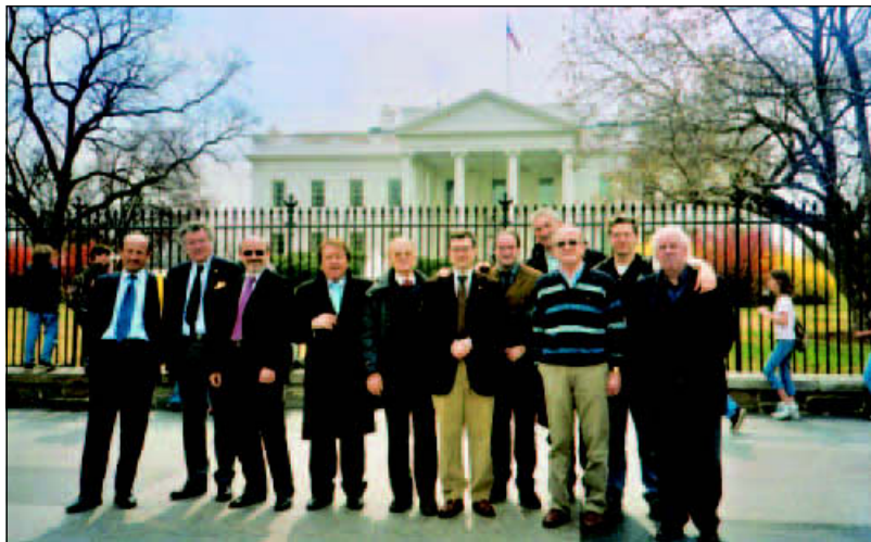
La delegazione dell'«Urbino Press Award» davanti alla Casa Bianca, a Washington

CASTELDELICI / Ieri la tragica fine per un agricoltore celibe Si spara al petto: 50enne morto sul colpo CASTELDELICI — Si è ucciso nella camera da letto di casa sua, sparandosi una fucilata al petto. E' successo ieri mattina verso le 10,30, in una casa isolata di campagna sopra Casteldelci. L'uomo, un 50enne, le cui iniziali sono S. A., celibe, agricoltore, è morto sul colpo. Sul posto sono arrivati i sanitari del 118 di Novafeltria oltre ai carabinieri della stazione di Pennabilli per i rilievi di legge. L'arma, sequestrata dai carabinieri, era stata regolarmente denunciata dal 50enne. Pare che l'uomo soffrisse ultimamente di una forte depressione. I carabinieri non hanno riferito di aver trovato biglietti o altri scritti che spiegassero il gesto. Questa mattina verrà svolta l'ispezione cadaverica.